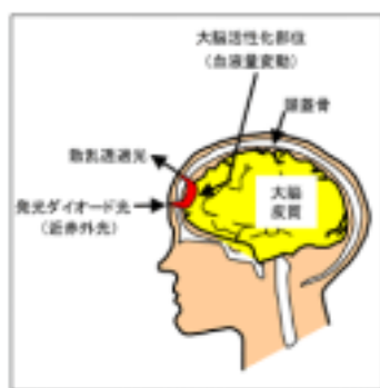
図1. 脳血液測定の実理

血液量の測定には、人体を透過しやすい近赤外光を使います。頭蓋骨を通して光を脳に送ると、脳の表面付近で散乱され、光の一部が頭蓋骨を通過して戻ってきます(図1参照)。戻ってくる光量(検出光量)が減るのは、血液量が増加し、増加した血液に光が吸収されるからです。逆に、検出光量が変わらないのは、血液量も変わらないことを意味します。この様に検出光量と血液量の増減は逆の関係にあります(図2参照)。測定は「安静期間」「回答期間」「安静期間」の3区間からなります。最初の「安静期間」は計測を始めるための準備期間であり、「回答期間」は「はい/いいえ」の回答を得る区間、最後の「安静期間」は「回答期間」とのデータ変動の差異を見る区間です。各区間は12秒あり、一つの回答を得るのに36秒かかります。